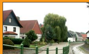
Straße an der Beber Rengelrode