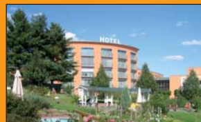
Hotel am Vitalpark